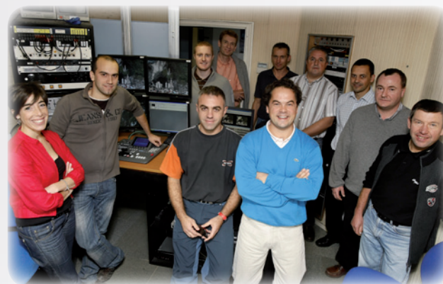
L'équipe Multimédia des Sanctuaires regroupe :

2009 : retransmission vidéo quotidienne à 18h00 du chapelet récité à la Grotte en italien en partenariat avec la chaîne TV 2000.