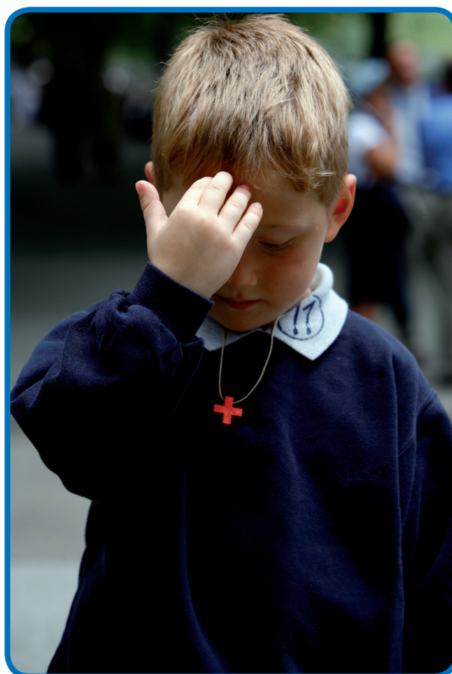
© Imprimerie de la Grotte / Sanctuaires Notre-Dame de Lourdes Impression EURL Basilique du Rosaire - Octobre 2009

E.H. Régis-Marie de La Teyssonnière en P. Horacio Brito