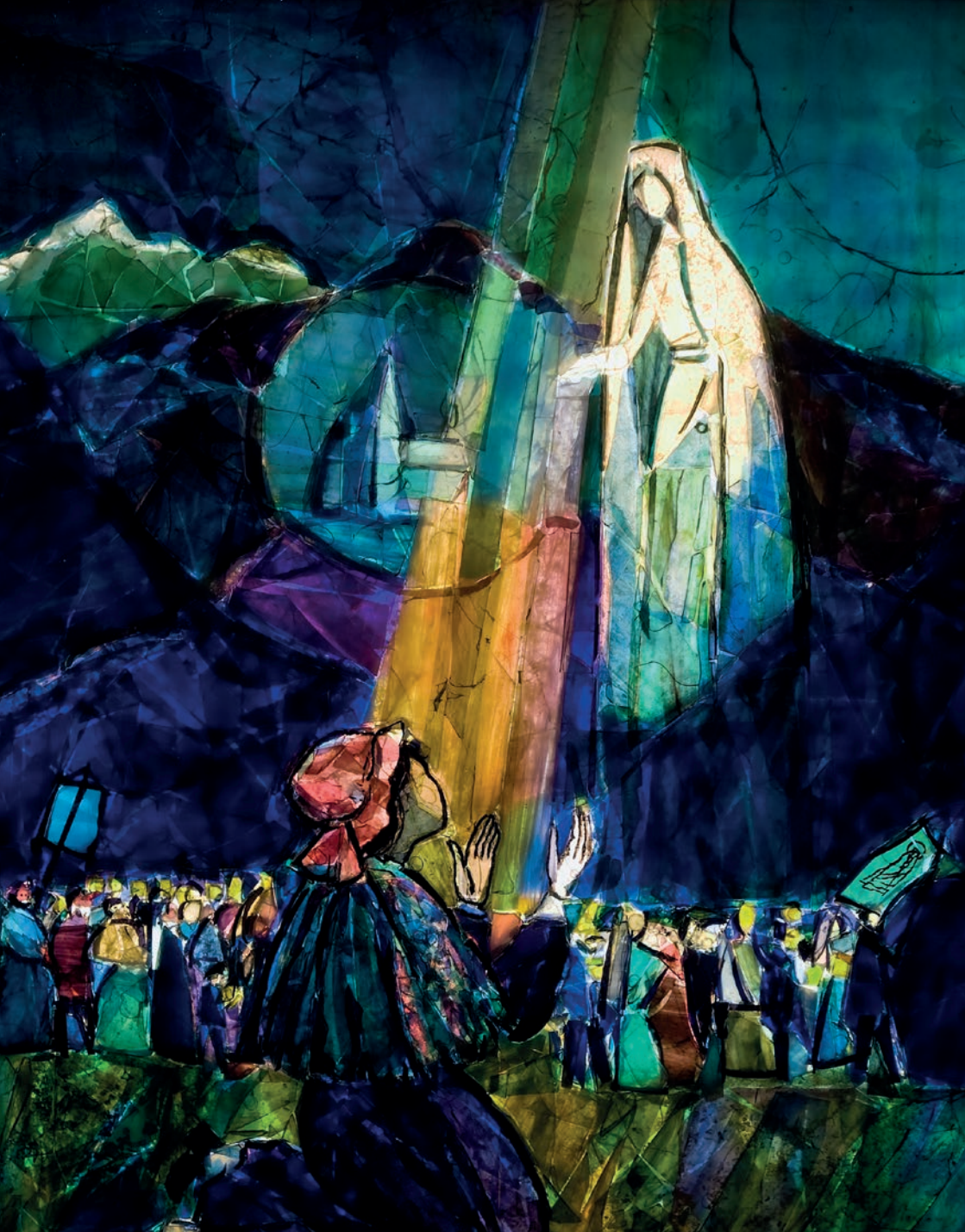
Voorstelling in gemmail van de 13de verschijning. Heilige-Pius-X-basiliek. Naar Margatton. Gemaakt door Germaine en Jean-Paul Sala Malherbe.