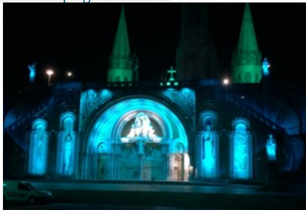
Il sistema DMX consente una gamma infinita di colori.

Valorizzare il patrimonio del Santuario migliorando l'accessibilità all'area per i non vedenti e per le persone a mobilità ridotta.