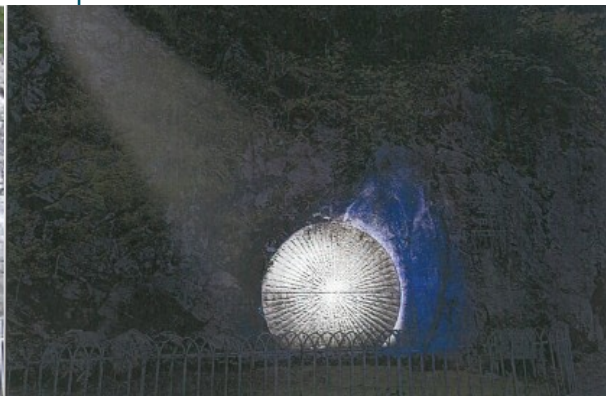
Espélugues il sepolcro della Via Crucis